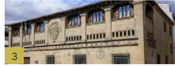
3 Antiguas Carnicerías El edificio fue construido durante el reinado de Carlos I, (primera mitad del siglo XVI) fuera de los límites de la ciudad.