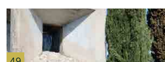
49 Monumento a Machado Escultura de bulto redondo, cuyo escultor fué Pablo Serrano.