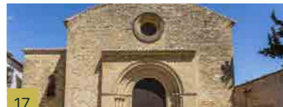
17 Iglesia de la Santa Cruz Obra del s. XIII de claro estilo tardo románico, que se conserva tras la conquista cristiana.