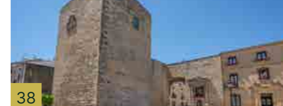
38 Puerta de Úbeda y Torreón Fue una de las mejores puertas fortificadas de todo el recinto amurallado medieval.