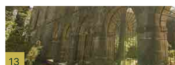
13 Palacio de los Obispos. Centro de Formación Feminista Carmen Burgos Palacio que se comienza a edificar en el s. XV y que tuvo reformas hasta el siglo XVIII.