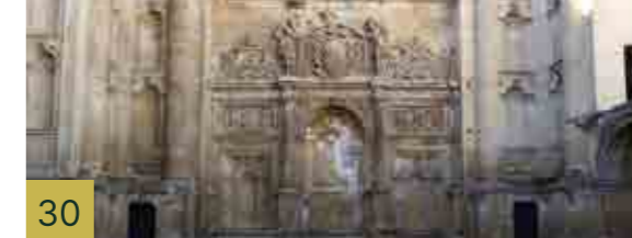
30 Convento de San Francisco Complejo funerario y conventual donde Andrés de Vandelvira derrochó toda su genialidad.