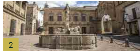
2 Fuente de los Leones Durante siglos fue la fuente principal de la ciudad. Según algunos historiadores, este conjunto pertenece a la cercana ciudad romana de Cástulo.