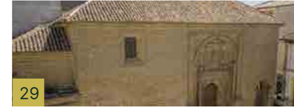
29 Iglesia y antiguo Hospital de la Concepción Complejo religioso y hospitalario que estuvo en funcionamiento desde 1529 hasta 1940.