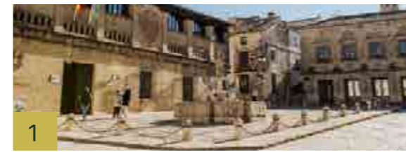
1 Plaza del Pópulo o de los Leones Es uno de los espacios públicos más importantes y simbólicos de la Baeza recién conquistada.

Baeza's natural landscape is another one of its great assets, with sites including the city's olive groves, whose gentle slopes roll off into the distance, or the Laguna Grande, an 19th-century artificial wetland and nature reserve, home to native and migratory bird species. The Museum of Olive Culture also allows visitors to learn more about olive farming traditions and sample different olive oils. Thanks to its strategic location, you can also visit the Cazorla, Segura and Las Villas Nature Reserve in the same day.