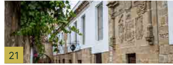
21 El Pósito Real Es una construcción del siglo XVI, como indica la cartela de la portada. Se sitúa a espaldas del edificio de la Alhóndiga, ambos edificios estaban comunicados entre sí, sirviendo éste de almacén del grano.