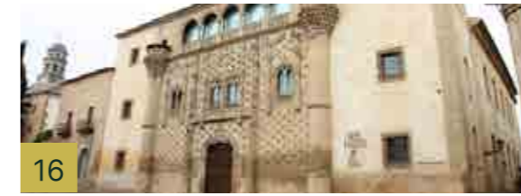
16 Palacio de Jabalquinto Es uno de los máximos exponentes del estilo gótico Isabelino, construido a finales del siglo XV.