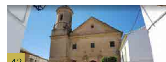
42 Iglesia de los Trinitarios Descalzos. Auditorio de los Descalzos Único ejemplo de iglesia con planta elíptica en Baeza, cuya construcción finaliza en el siglo XVIII.