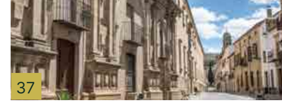
37 Antiguo Colegio de Santiago de la Compañía de Jesús. Centro de Ferias y Congresos de Baeza Edificio que se empieza a construir en el último tercio del siglo XVI y que con posterioridad ha sufrido múltiples ampliaciones y remodelaciones.