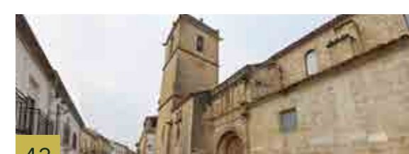
43 Iglesia de San Andrés Edificio de comienzos del siglo XVI que ostentó el título de Colegiata desde 1764 hasta 1852.