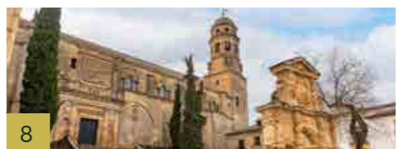
8 La Catedral Antigua mezquita aljama de la Baeza musulmana. En 1227 pasa a ser, baja la advocación mariana de “la Natividad” sede catedralicia. En el s. XVI se hace una reforma, que será la que imprima al edificio el sello renacentista de Andrés de Vandelvira.