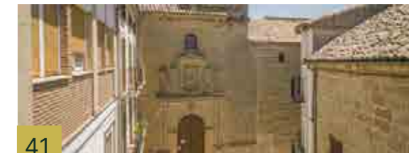
41 Convento de la Encarnación Fundación conventual en Baeza de la Orden de las Carmelitas Descalzas, en 1599.