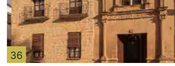
36 Casa de los Cabrera Casa solariega de principios del siglo XVI de estilo plateresco.