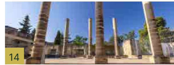
14 Iglesia de San Juan Bautista Uno de los templos tardo-románicos más importantes de la ciudad, que estuvo abierto al culto hasta 1843.