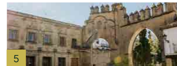
5 Puerta de la Azacaya o de Jaén y Arco de Villalar La puerta de la Azacaya o de Jaén, es uno de los reductos del recinto amurallado y el arco de Villalar se levantó para conmemorar la victoria de las tropas imperiales de Carlos I.