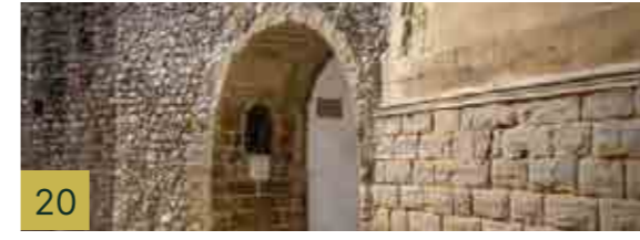
20 Arco del Barbudo Puerta de acceso a la ciudad amurallada medieval, con una hornacina con un lienzo de la Virgen con Niño.