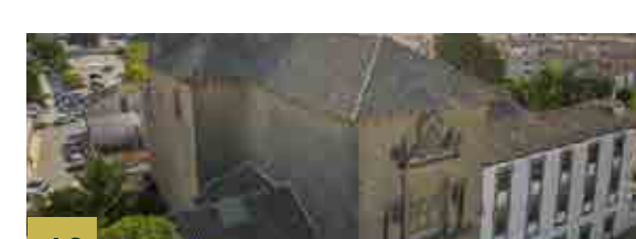
46 Iglesia de San Ignacio Complejo Jesuítico que funcionó como colegio-seminario desde los primeros años del siglo XVII hasta la desamortización.