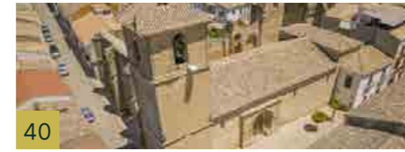
40 Iglesia de El Salvador Construcción del siglo XV con importantes remodelaciones y ampliaciones durante el siglo XVI.