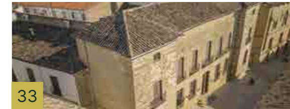
33 Palacio de los Sánchez Valenzuela. Nuevo Casino Construido a finales de siglo XV y destinado con posterioridad a la orden de clausura de las monjas mínimas de San Francisco de Paula de San Ildefonso.