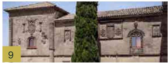
9 Casas Consistoriales Altas Edificio de finales del siglo XV, cedido al Concejo y ampliado en el s. XVI.