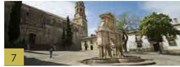
7 Plaza de Santa María En ella se han aunado durante siglos los poderes más importantes de la ciudad: el religioso y el civil.