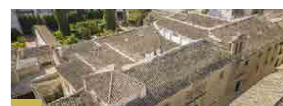
44 Convento de la Magdalena Fundación de 1568 como convento de la Orden de San Agustín.